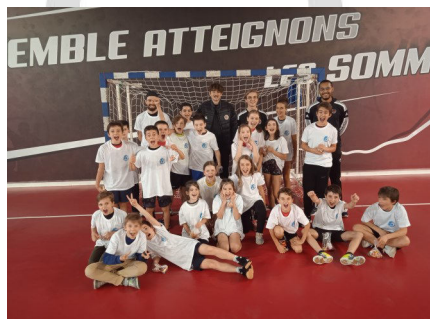
Les jeunes du stage joueurs

La semaine s'est clôturée par le tournoi d'halloween durant lequel les enfants se sont affrontés tout l'après – midi.