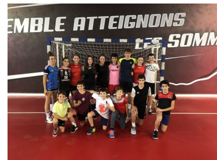
Les jeunes arbitres